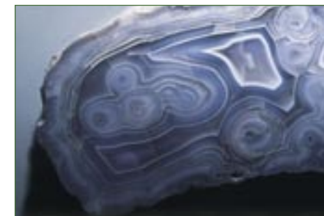
Achát (Muzeum Českého ráje v Turnově).