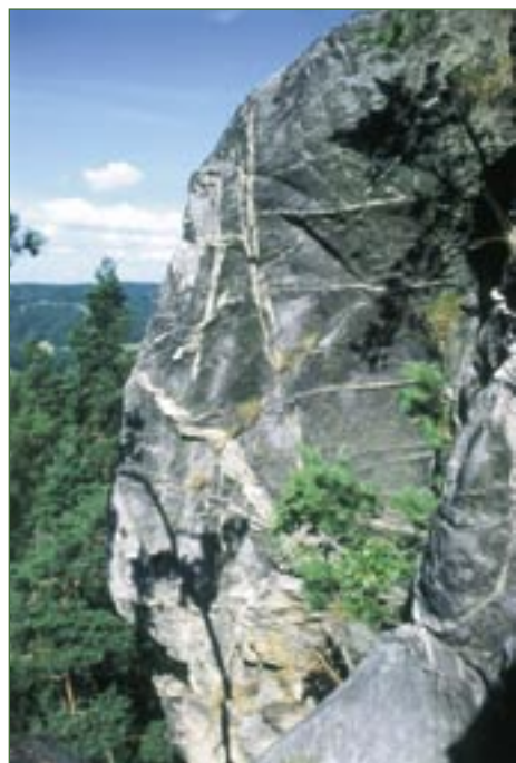
Cenomanský pískovec na Suchých skalách.

metličky křivolaké ( Avenella flexuosa ) a hasivky orličí ( Pteridium aquilinum ), na skalách se vyskytuje vřes obecný ( Calluna vulgaris ). Tvrdý pískovec s množstvím inkrustací je velmi atraktivní horolezeckou lokalitou.