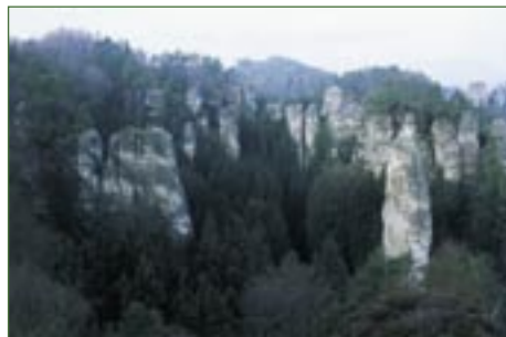
Hruboskalské skalní město.

Hruboskalské skalní město je jedním z nejrozsáhlejších a nejnáměšších skalních měst v Českém ráji i celé České republice. Na hraně tektonické kry stojí skalní věže, které byly původně součástí kompaktního skalního masivu. Tvář skalního města vznikala ve čtvrtohorách, kdy se vytvořily skalní římsy, voštiny, dutiny, okna a další útvary charakteristického mikroreliefu pískovcových skal. Na vrcholech věží a na okrajích skalních masivů se zachovaly reliktní bory, na příznivějších substrátech pak borové doubravy a kyselé bučiny. Vzácně zde přežila i jedle bělokorá. Nejčastějšími druhy podrostu jsou borůvka černá ( Vaccinium myrtillus ), vřes obecný ( Calluna vulgaris ) či hasivka orličí ( Pteridium aquilinum ). V údolích jsou v bučinách časté kapradiny – kapraď rakouská ( Dryopteris carthusiana ), kapraď pravá ( Dryopteris dilatata ) či žebrovice různolistá ( Blechnum spicant ), kolem prameništ se vytvořily olšiny s hojnou přesličkou největší ( Equisetum tel-