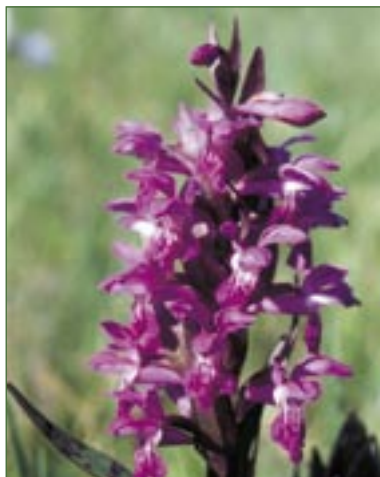
Prstnatec májový ( Dactylorhiza majalis ).