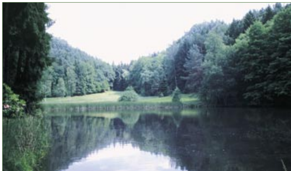
Rybniček v PP Vústra.

Spravuje Správa CHKO Český ráj, tel.: 481 321 900