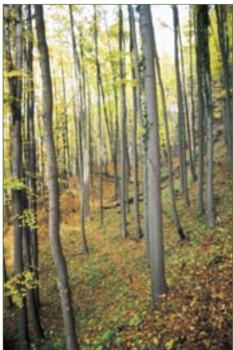
Bučiny u Rakous.

V údolí řeky Jizery se vyskytují nejzachovělejší květnaté bučiny v Českém ráji. Přírodní rezervaci tvoří lesní porost s dominantním bukem lesním na strmých svazích podél silnice vedou-