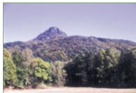
Vrchol Ralsko (696 m n. m.).

vyšazený druh kontryhele ( Alchemilla conjuncta ). Součástí podrostu květnaté bučiny a suťového lesa jsou chráněné druhy árón plamatý ( Arum maculatum ), lilie zlatohlavá ( Lilium maritagon ), měsíčnice vytrvalá ( Lunaria rediviva ) či vzácná kapradina laločnatá ( Polystichum aculeatum ). V lese hnízdí holub doupňák ( Columba oenas ) nebo výr velký ( Bubo bubo ). K nejvzácnějším nálezům bezobratlých živočichů patří tesařík alpský ( Rosalia alpina ) a krasec lipový ( Poecilnota rutilans ).