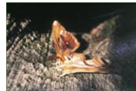
Martináček bukový ( Aglia tau ).

Na vrcholu Ralska stojí zřícenina stejnojmenného hradu s dochovanými prvky románského slohu – ty datují stavbu zhruba do konce 12. století. Poslední přestavba hradu proběhla počátkem 15. století.